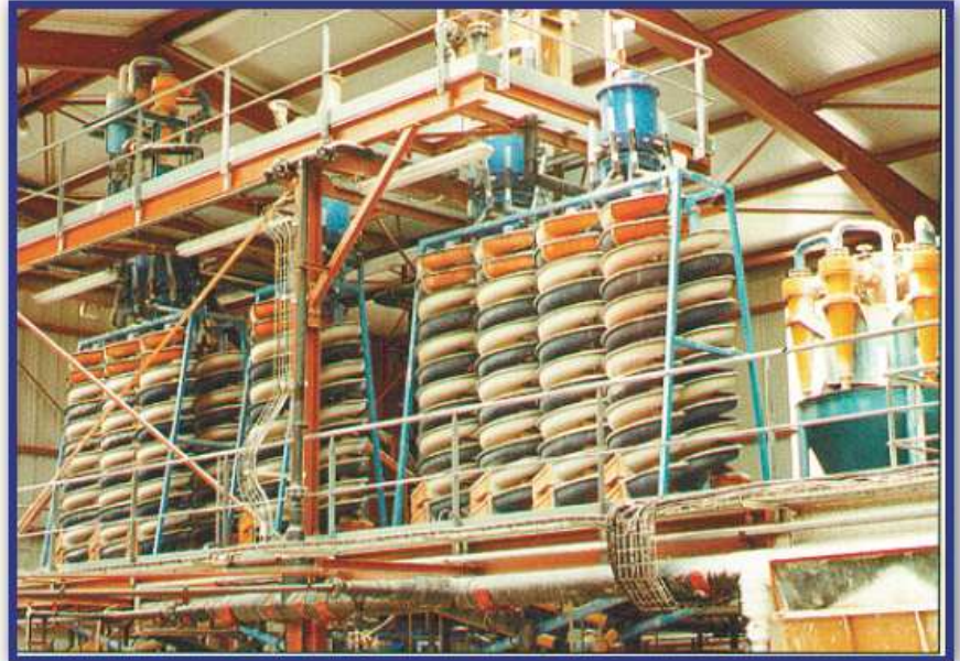
Zakład wzbogacania rud Cyny/Tantalu

Krebs posiada zestaw spiral dla przeróbki minerałów służący do przeprowadzania testów. Prosimy o kontakt telefoniczny