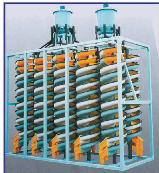
Wzbogacalniki spiralne technologii przeróbki minerałów KREBS SWMS

Wzbogacalniki spiralne typu MM są zaprojektowane dla wstępnej obróbki strumienia pulpy zawierającego cząstki średnio ciężkich minerałów o zagęszczeniu w przedziale 15-80% stężenia wagowego. Składają się one z: dystrybutora nadawy, pojedynczej sekcji spiralnej oraz komory zrzutu produktu. Rozdzielacze palcowe dokonują na powierzchni spirali podziału strumienia nadawy na: koncentrat, półprodukt i odpady z możliwością ich dalszej obróbki. Wzbogacalniki spiralne KREBS SWMS wymagają podczas funkcjonowania niewielkiego nakładu uwagi, a korekta ich nastaw konieczna jest jedynie w przypadku znaczących zmian zagęszczenia nadawy.