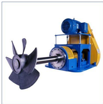
Mieszadła z wałem poziomym